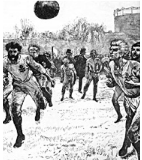
Pressezeichnung zum ersten Fußballländerspiel zwischen England und Schottland (1872)